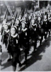
軍事訓練をする女学生