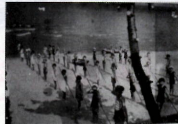
◀小学生のナゲナタ訓練

持ち主は昭和19年5月、中国山西省で地雷の爆発により重傷を負いつつも、生還されました。寄せ書きは激しく破損しています。