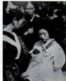
▲一針一針に必勝と生還を縫い込めた千人針の風景