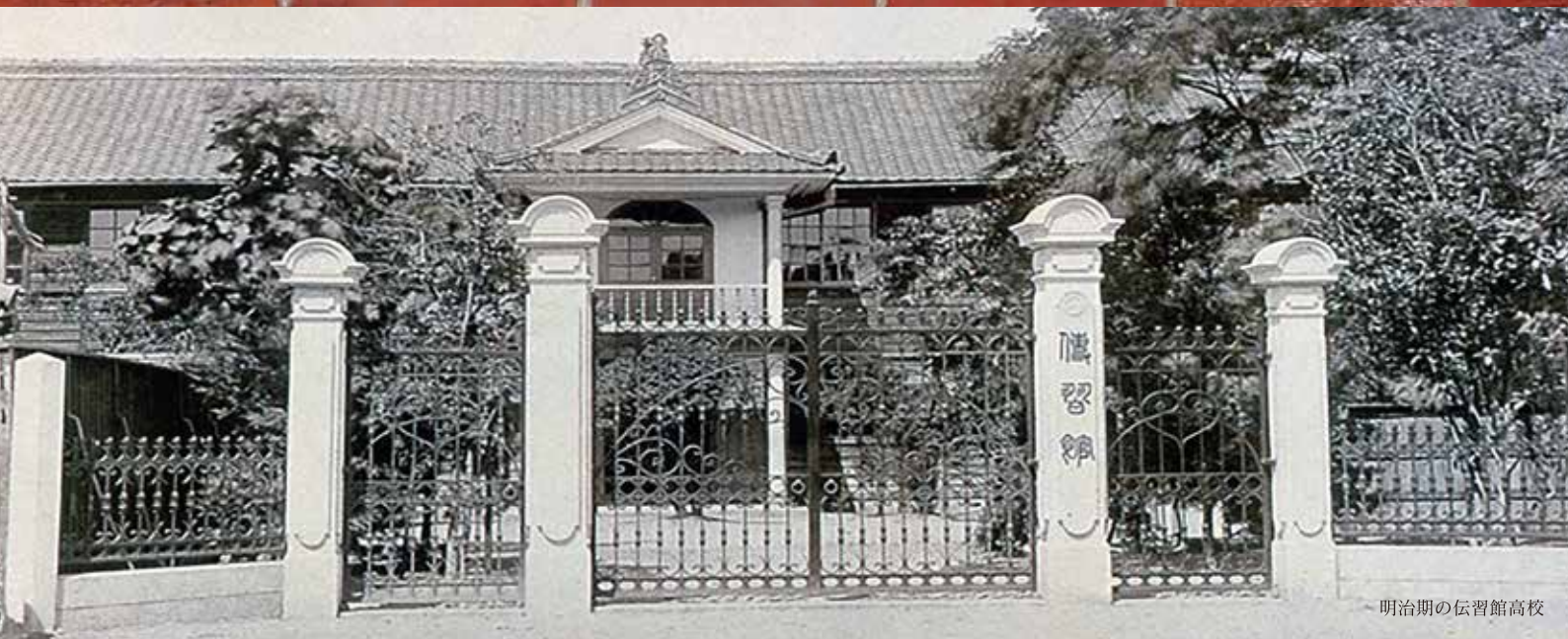
明治期の伝習館高校