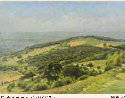
「トウスコロの丘(H25作)」