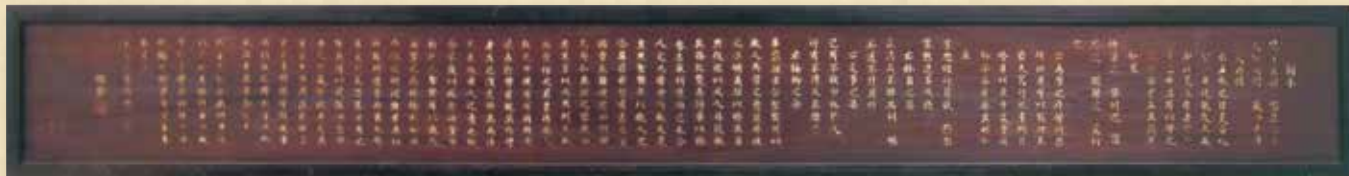
▲「伝習館高校」の玄関に展示してある、同校の教育指針となった「白鹿洞書院掲示」の写真